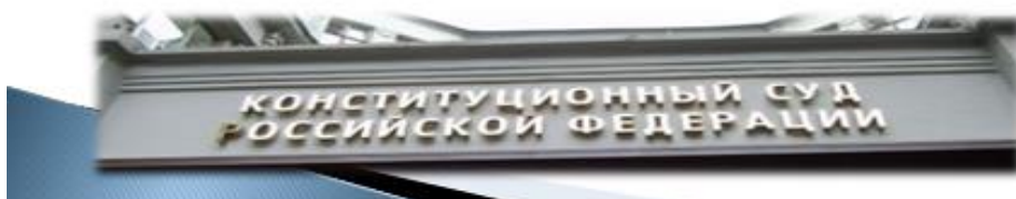
Рисунок 3. Аргументация, как один из способов устранения оперативно-розыскных ошибок.

Полагаю, что допущенное по настоящему делу нарушение следует признать несущественным, поскольку оно реально не повлекло лишения или стеснения гарантируемых законом прав участников уголовного судопроизводства, поскольку... Для проверки предлагаю...»;