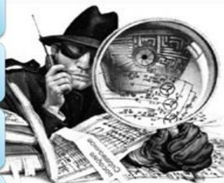
Рисунок 1. Оперативно-розыскные ошибки

4. связанные с использованием результатов ОРД на досудебных и судебных стадиях.